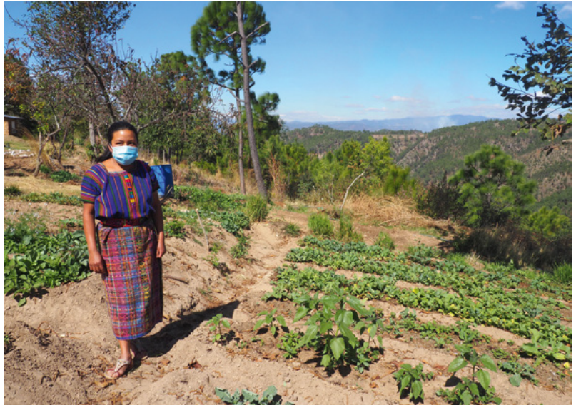
Unter anderem soll mit Gemüsegärten die Ernährungssouveränität gefördert werden.

In Guatemala zeigen die allerneuesten Daten des Human Development Report (HDR), dass die Armutsindizes seit Beginn der Coronakrise dramatisch in die Höhe gehen. Ein wichtiger Schritt für ein besseres Leben ist deshalb die Bekämpfung von Mangel- und Unterernährung. Mit einer nachhaltigen Pilzzucht und Gemüsegärten geht ein kfb-Partner:innenprojekt im westlichen Hochland dagegen an.