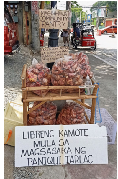
Süßkartoffeln gehören zu den Produkten, die unter dem Motto „Gib, was du kannst, nimm, was du brauchst“ angeboten werden.

Mit den Ständen knüpfte Non an eine alte Filipino-Tradition an: „Bayanihan“, der Geist der gegenseitigen Hilfe, ein Aufruf zu einem Miteinander auch in harten Zeiten. Die Tauschstände entstanden in der Not der Lockdowns und restriktiven Pandemiebestimmungen, in denen die Versorgung mit Lebensmitteln besonders schwierig war. Nach über zwei Jahren Pandemie kommen nun Teuerung, hohe Inflation und gestiegene Transport- und Energiekosten hinzu. Der Bedarf an „Bayanihan“, Zusammenhalt und solidarischer Nächstenliebe bleibt – insbesondere für von Armut betroffene Familien – bestehen.