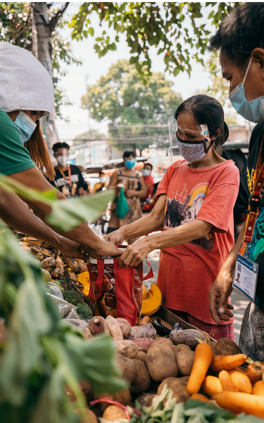
Die Tauschstände entstammen einer Filipino-Tradition und wurden als Reaktion auf die Covid-19-Pandemie aus der Not heraus wiederbelebt.

„Gib, was du kannst, nimm, was du brauchst“ steht auf den Schildern der Tauschstände, die überall auf den Philippinen entstanden sind. Die sogenannten Community Pantries sind nicht nur aktive Nachbarschaftshilfe, sondern auch Zeichen der Solidarität und Nächstenliebe in schwierigen Zeiten. Sie entstammen der Filipino-Tradition „Bayanihan“.