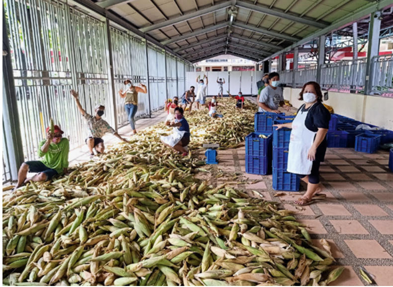
Auch Vereine und diverse Organisationen unterstützen die Aktion.