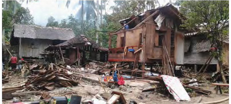
Bei Überschwemmungen kommt dank des kfb-Partner*innenprojekts AKKMA Hilfe im philippinischen Armenviertel bei den Menschen an.

Die Auswirkungen der Klimakrise treffen den Globalen Süden am meisten – und die marginalisierten Menschen dort am härtesten. Mit Überschwemmungen nach Tropenstürmen müssen die Bewohner*innen auch im Armenviertel C. F. Natividad auf den Philippinen umgehen lernen, denn sie kommen immer wieder. Das kfb-Partner*innenprojekt AKKMA hilft in der Not – und leistet Präventionsarbeit.