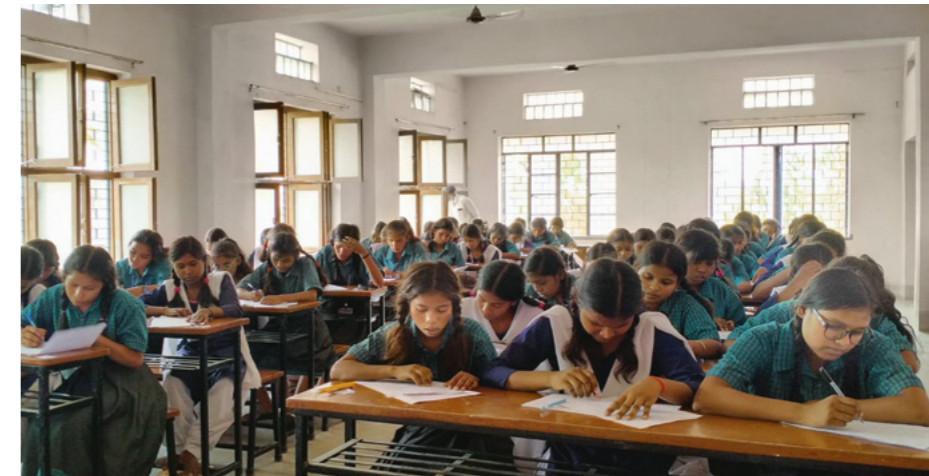
Schulbildung ist der Schlüssel zu einem besseren Leben für die Dalit-Mädchen.