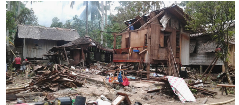
Bei Überschwemmungen kommt dank des kfb-Partner*innenprojekts AKKMA Hilfe im philippinischen Armenviertel bei den Menschen an.

Die Auswirkungen der Klimakrise treffen den Globalen Süden am meisten – und die marginalisierten Menschen dort am härtesten. Mit Überschwemmungen nach Tropenstürmen müssen die Bewohner*innen auch im Armenviertel C. F. Natividad auf den Philippinen umgehen lernen, denn sie kommen immer wieder. Das kfb-Partner*innenprojekt AKKMA hilft in der Not – und leistet Präventionsarbeit.