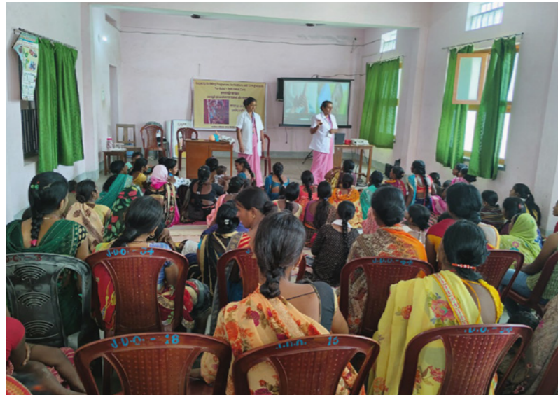
Frauen stärken: Das kfb-Partner*innenprojekt setzt neben Aus- und Weiterbildungen auch auf Präventionsarbeit in Gesundheitszentren.