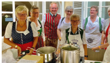
Beim „Aufsteirern“ in Graz wurden schmackhafte Suppen kredenzt – auch in der To-go-Variante.