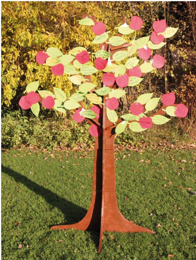
Die Visionen wurden auf Blätter, Blüten und Äpfel angebracht.

dem sie ihre Visionen und Wünsche für den Wandel und „ein gutes Leben für alle“ auf die Blätter notierten und an den Baum klebten. Die Ernte war üppig, denn manch eine*r brachte auch Papieräpfel an – als Zeichen des Wandels, der bereits passiert. „Der Stamm des Baumes, das sind wir. Die Blätter stehen für unsere Visionen und den Weg, die Früchte für die veränderte Welt“, erklärten die Teilnehmer*innen des Symposiums.